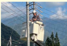
インフラ部門 作業風景