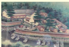
第9回 長野市景観賞 雲上閣美山亭