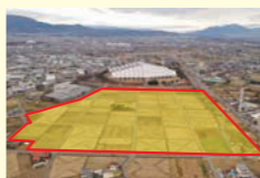
エムウェーブ南 産業用地開発